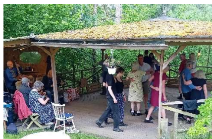
Spel-och-Dans-knyttis i Jonsered

Våravslutningen blev en härlig Danskväll tillsammans med Tagel och Compani och Triol, som turades om att bjuda oss på goda låtar. Som grädde på moset fick vi också en inbjudan från Katrine och Tommy till Spel-och-Dans-knyttis i deras härliga trädgård i Jonsered i mitten av juni. Kalaset började soligt och varmt och dansen trädde av hjärtans lust på dansbanan till spel av alla som ville spela. Roligt för det uppstod också lite nya konstellationer av spelfolk, som hittade varandra.